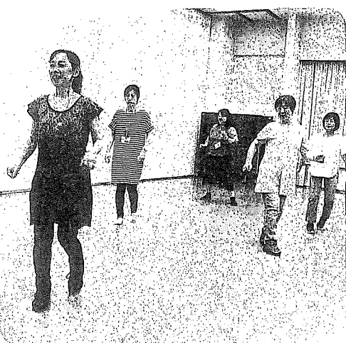
趣味の体験講座「ワンネスラインダンス」

も、アイリッシュ、ラテン、オーレディーズからポップまで。：と実に多様化しています。振付は世界公認のステップシート(振付のステップ譜)が初級から上級まで数多く登録されておりそれは世界中どこへ行っても共通です。知っている曲なら言葉が通じなくても踊ります。輪、ならぬ列、に入って一緒に踊ることが出来ます。もともと旅先で偶然そんなシチュエーションに出くわすことはまず滅多に無いとは思いますが、そのコンセプトは「小さな世界そのもの。振付を覚えることやリズムカルな音楽に合わせるステップを踏むことが脳の活性化を促し身体機能の退化を予防します。しかもステップのパターンは単なる繰