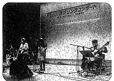
春いちばん文化まつり「洋楽スプリングコンサート」

まだまだすつきりとは収まらないコロナ騒動の中、会員の皆様には本格的な活動もままならないことと推察致します。当然のことながら協会年会費の徴収も滞りがちと思えます。しかし希望的観測ですが、秋になれば各サークルの活動もそこで元に戻るのではないのでしょうか。事務局方では出されば10月ないしは11月初め、遅くとも年内に会費の徴収をして頂ければと思っております。いろいろとご苦勞もあるかと思いますが、よろしくお願いたします。