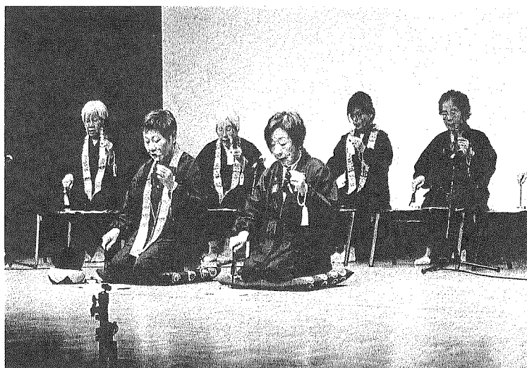
古典芸術のつどいで演奏する大和講城陽の会

活動は毎週月曜日午後1時 から福祉センター2階でお稽 古をしています。活動として は、年1回文化 芸術協会主催 「春いちばん文 化まつり・古典 芸術のつどい」 に出演していま す。